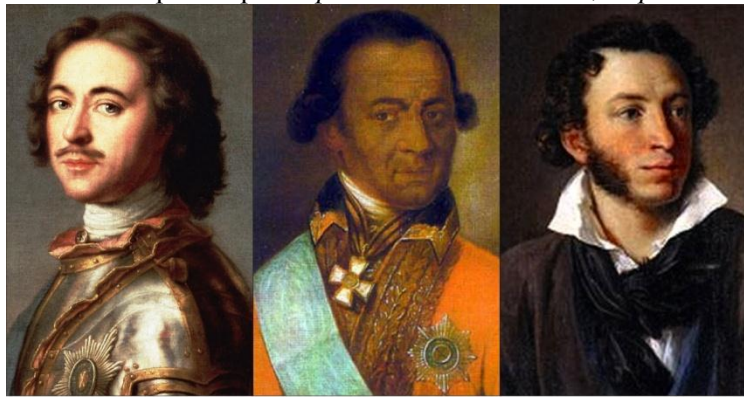
Пётр Алексеевич Романов

3. На проектор Пётр Алексеевич Романов, Абрам Петрович Ганнибал, Александр Сергеевич Пушкин